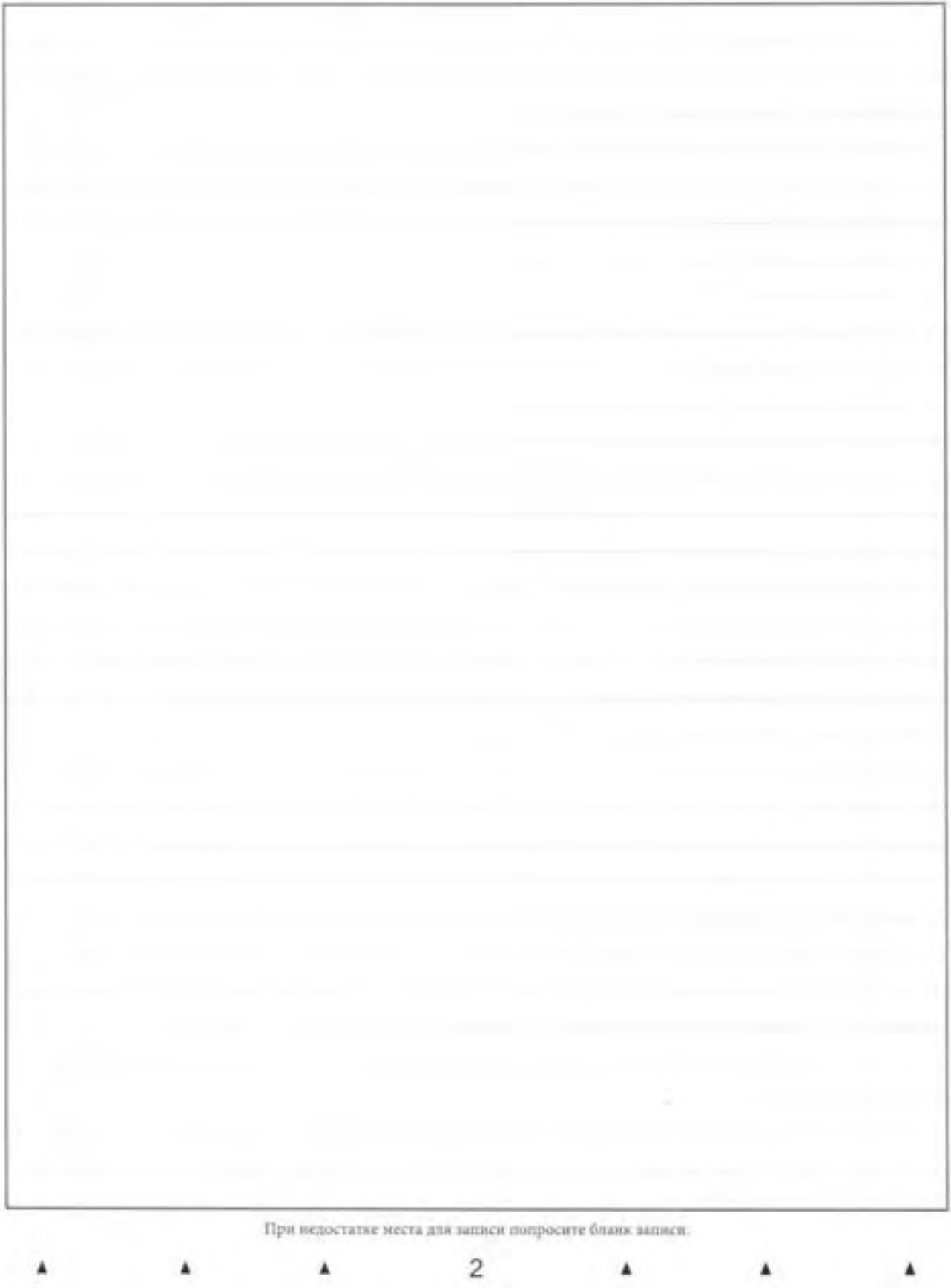
Рис. 6. Обратная сторона двустороннего бланка записи