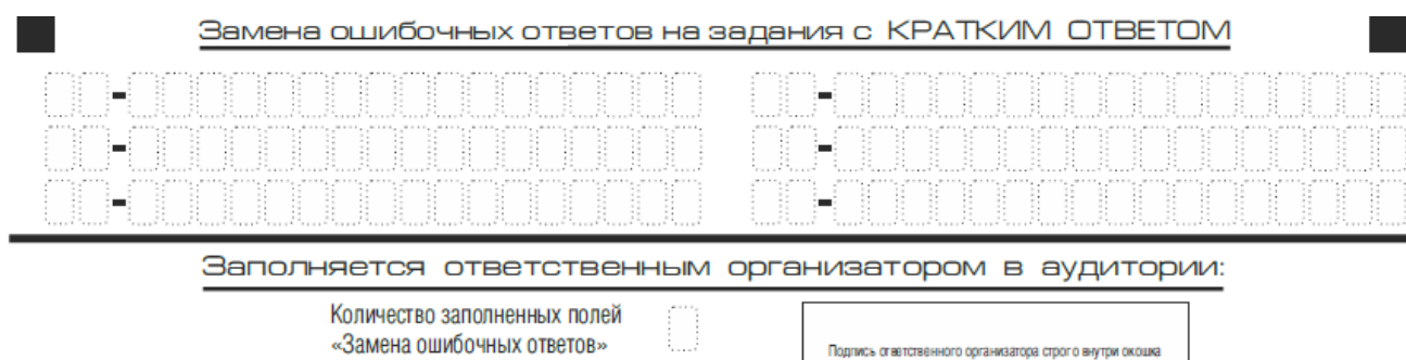
Рис. 9. Область замены ошибочных ответов на задания с кратким ответом

Запрещается записывать ответ в виде математического выражения или формулы. В ответе не указываются названия единиц измерения (градусы, проценты, метры, тонны и т.д.) – так как они не будут учитываться при оценивании. Недопустимы заголовки или комментарии к ответу.